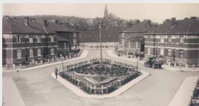
Cité Wauters - Rue A. Defuisseau - 1939