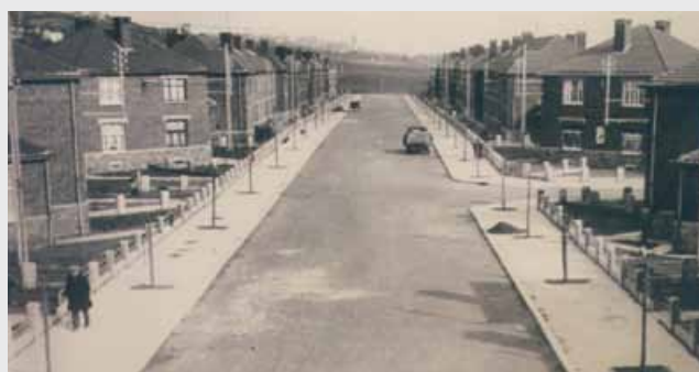
Cité Wauters - Rue A. Smets - 1939

Il faut aussi ajouter à ces bonnes nouvelles que l'Agence immobilière sociale envisage quant à elle la prise en gestion d'une dizaine de nouveaux logements par an, soit une croissance de 60 logements sur la durée de la législature communale. « Et le CPAS a lui aussi choisi d'augmenter son offre en matière de logements de transit et d'urgence... »